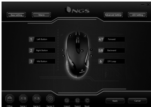
Main control settings