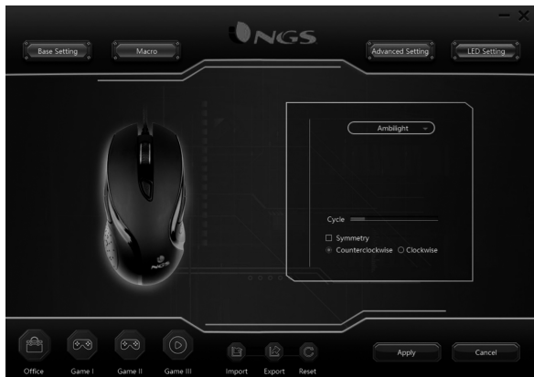
Breathing light setting